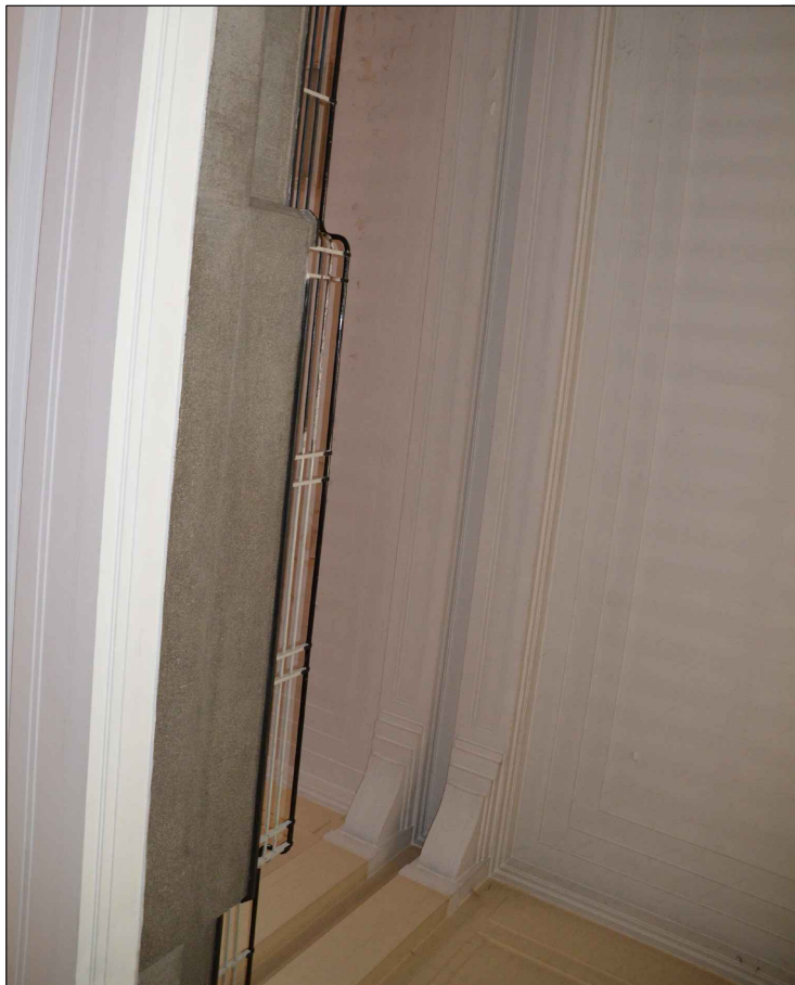
VUE I : Démolition de la dalle de toiture de la dernière travée sur l'image ci-joint et par conséquent, ses moulures / création de la trémie du nouvel escalier Ouest donnant accès à l'extension